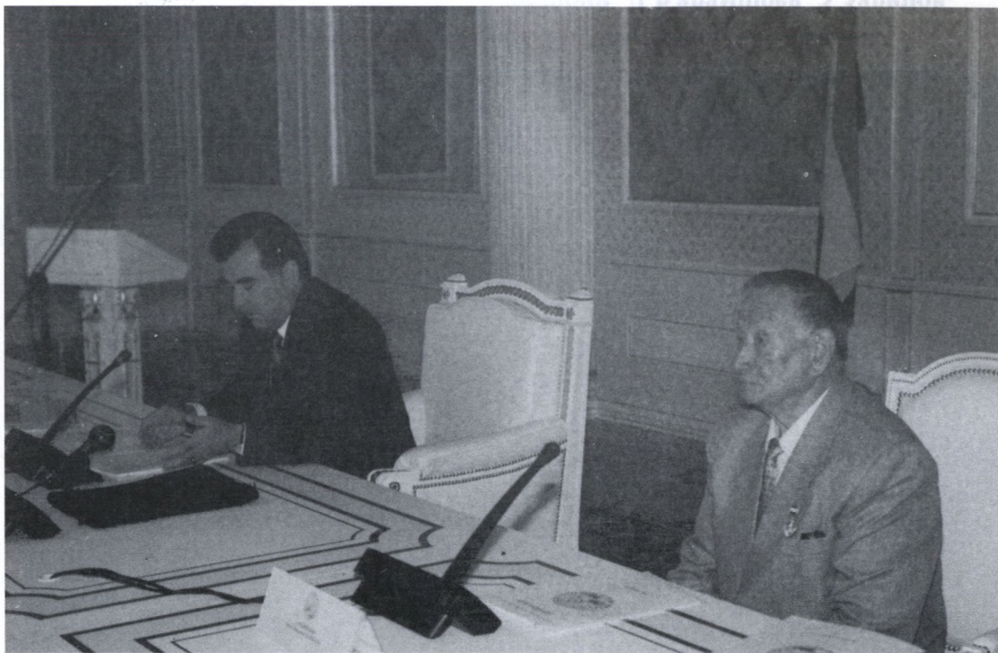
Дар раёсати Анҷумани чоруми тоҷикон ва форсизабонони дунё