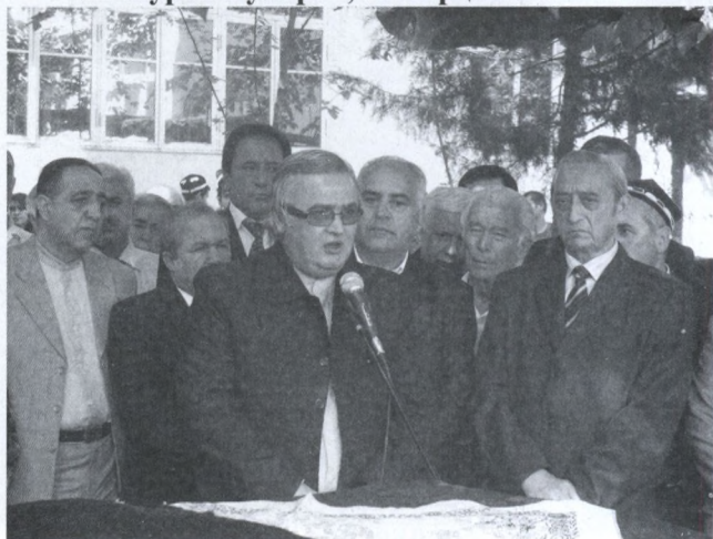
Суҳанрони сафири кабири ЧИЭ, доктор Алиасғари Шеърдӯст дар маросими дафни устод. 10 майи соли 2008.